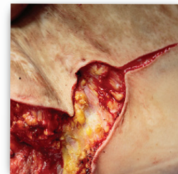
Lumière chaude de Q-Series