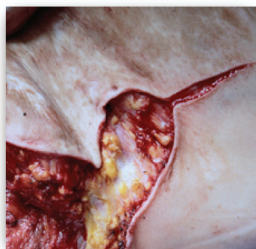
Lumière froide de Q-Series